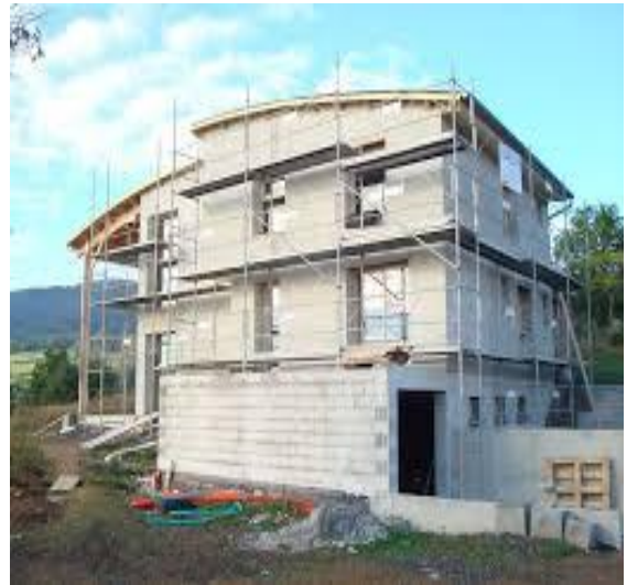
construction en cours