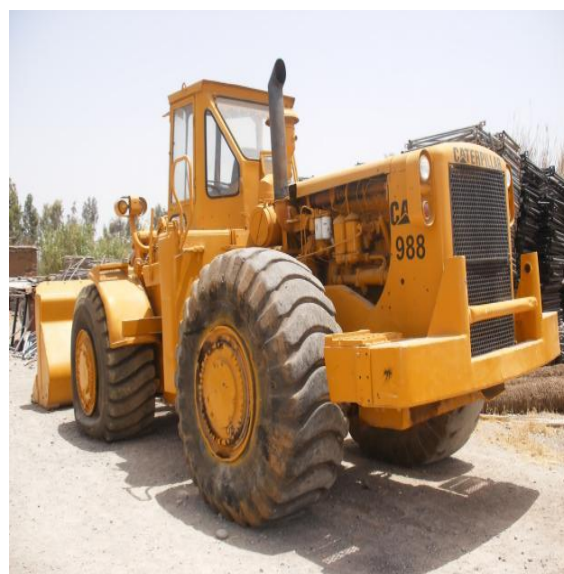
Chargeuse CA 988