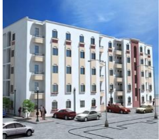
Construction d'un immeuble R+4