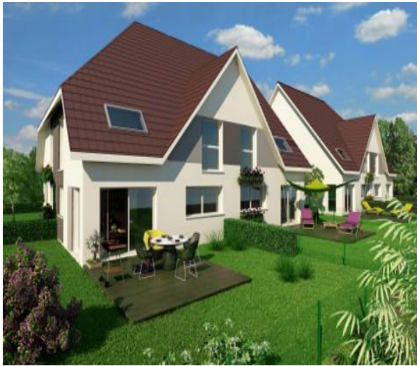
Appartement en Italie