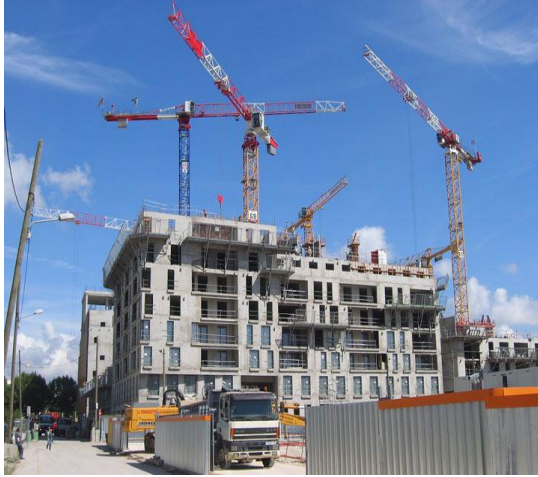
Construction d'un immeuble R+4 en Italie